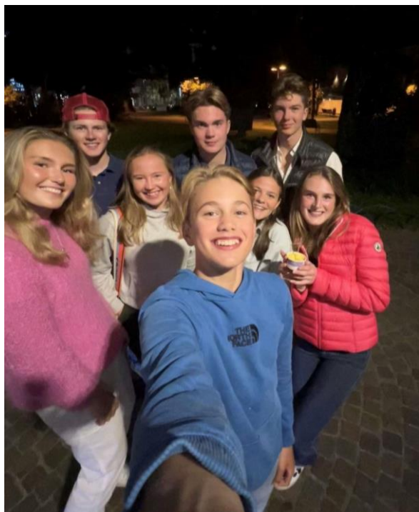
Det norske laget under EuroCup-finalen i Riva del Garda i oktober