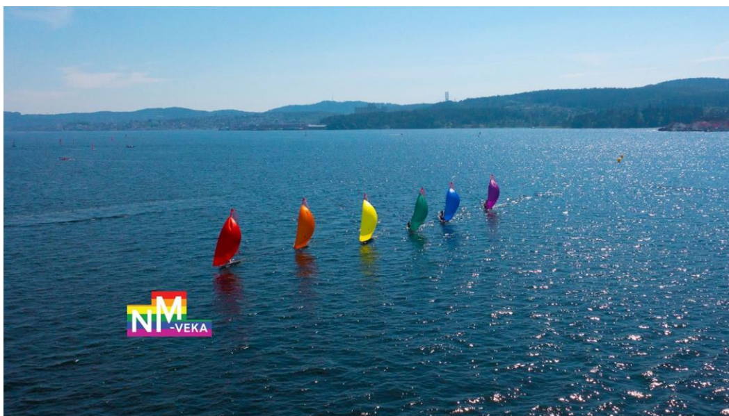
Fantastiske forhold under NM i Brevik