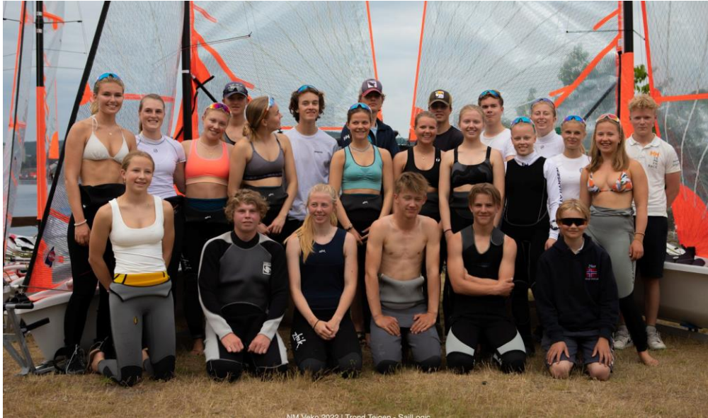
Alle 29er-seilerne under NM i Brevik