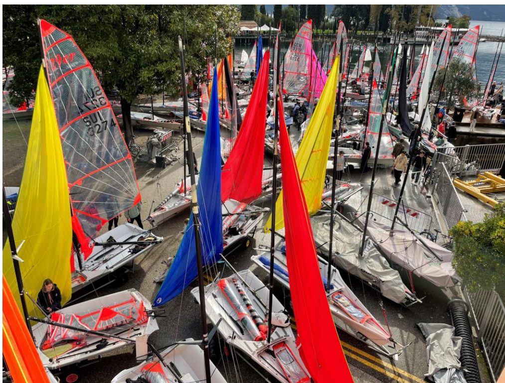
Fullt av 29ere under EuroCup-finalen i Riva del Garda i oktober