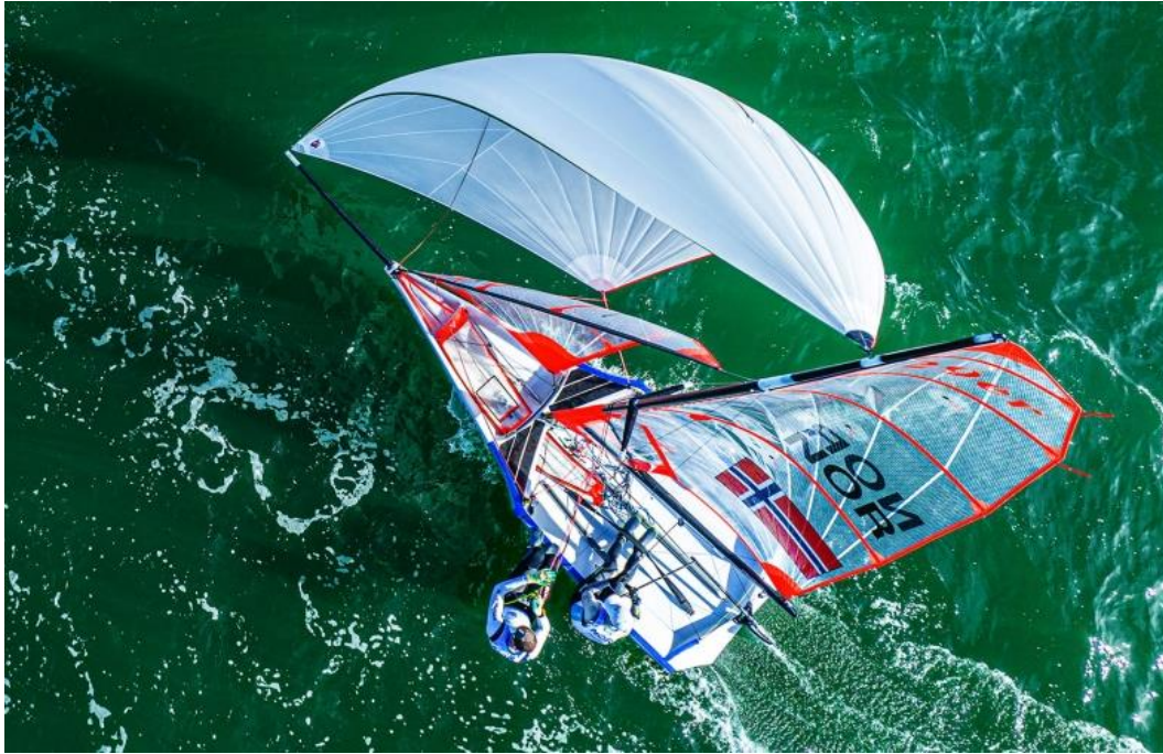
Balder og Emil fra World Sailing Youth Worlds i Haag