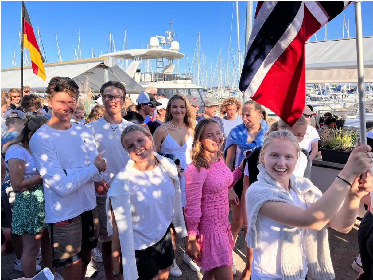
Den norske delegasjonen i forbindelse med åpning av EM i Århus